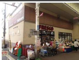
スーパーフレッシュ 徒歩2分(140m)