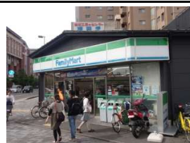
ファミリーマート 徒歩1分(80m)