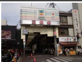
三条会商店街 徒歩1分(50m)