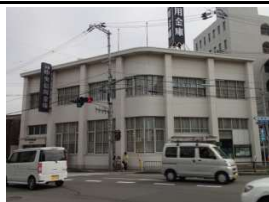
京都中央信用金庫 徒歩1分(60m)