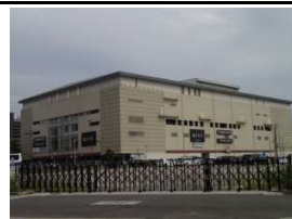
Bivi二条(複合商業施設) 徒歩5分(330m)