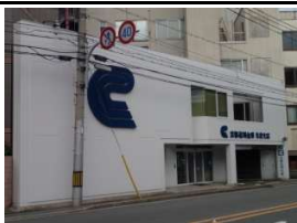
京都信用金庫 徒歩1分(50m)